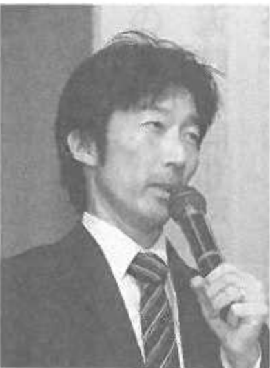
熊本県立済々黌高校 グローバルキャリア課 課長